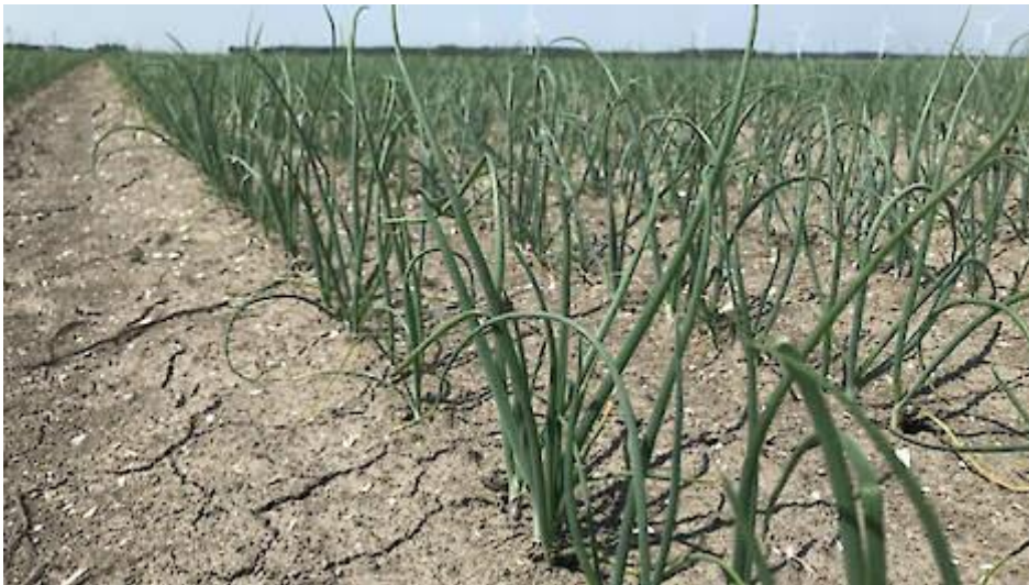
Foto boven: Eerste toepassingsmoment gewasbespuiting Hamerol in zaaiui

Werkzaamheid: De eerste bespuiting met Hamerol zorgt ervoor dat processen die de plantweerbaarheid in de plant regelen, worden geactiveerd. Dit zorgt ervoor dat de plant weerbaarder wordt tegen bladziektes als valse meeldauw en Stemphylium.