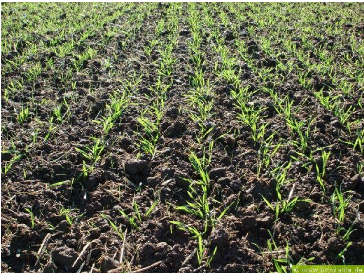
Foto boven: Eerste toepassingsmoment gewasbespuiting Hamerol in wintertarwe

Werkzaamheid: De eerste bespuiting met Hamerol zorgt ervoor dat processen die de plantweerbaarheid in de plant regelen, worden geactiveerd. Dit zorgt ervoor dat de plant weerbaarder wordt tegen bladziektes als Septoria, roest en Fusarium. Ook kan een bespuiting met Hamerol vroeg in het seizoen leiden tot een opbrengstverhoging.