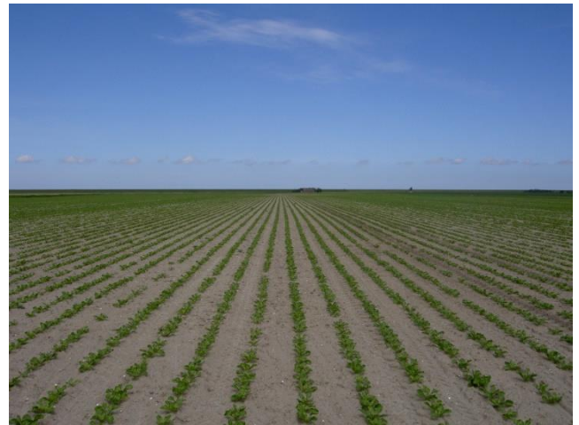
Foto's boven: Eerste toepassingsmoment gewasbespuiting Hamerol in suikerbiet

Wanneer de eerste vlekjes veroorzaakt door bladschimmels op het blad ontstaan, een bespuiting met een fungicide doen.