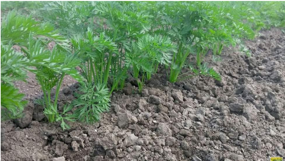
Foto boven: Eerste toepassingsmoment gewasbespuiting Hamerol in peen

Werkzaamheid: De eerste bespuiting met Hamerol zorgt ervoor dat processen die de plantweerbaarheid in de plant regelen, worden geactiveerd. Dit zorgt ervoor dat de plant weerbaarder wordt tegen bladziektes als meeldauw en Alternaria.